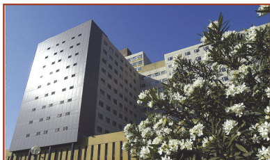
Hôpital de la Timone Hôpital d'adultes- Hôpital d'enfants 264 rue Saint Pierre 13385 Marseille Cedex 5