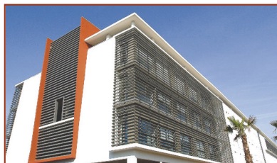
Hôpital de la Conception 147, Boulevard Baille 13385 Marseille Cedex 5