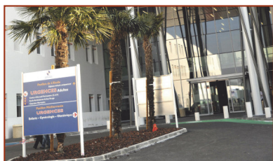
Hôpital Nord (adultes et pavillon mère/enfant) Chemin des Bourrelly 13915 Marseille Cedex 20