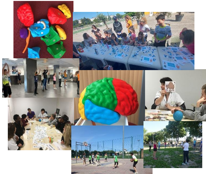
Programme d'Éducation Thérapeutique – CHU de la Timone